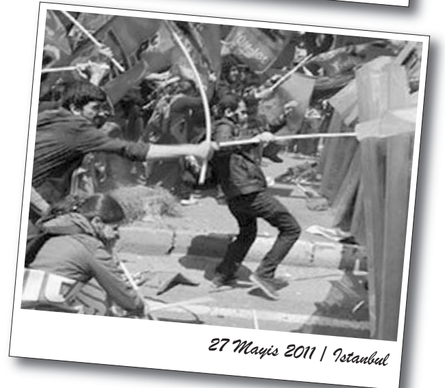
27 Mayıs 2011 | İstanbul

Devletin azgın terörü ile hareketin dağılık tablosu bu çıkışların birleşik-devrimci bir biçime dönüşmesine izin vermedi. Bunun kaçınılmaz bir sonucu olarak, sermayenin saldırıları bütünlüklü bir mücadele ile karşılanamadı. Kararlı ve militan eylemlere dayalı süreçler yaratılamadığı için saldırılar püskürtülemedi.