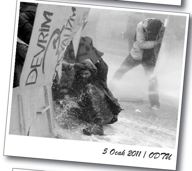
5 Ocak 2011 | ODTÜ