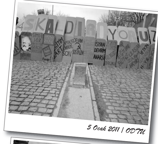
5 Ocak 2011 | ODTÜ

Özetleyecek olursak 2011, gençlik hareketinin belli sınırlarda da olsa çıkışlar yaşadığı bir yıl oldu.