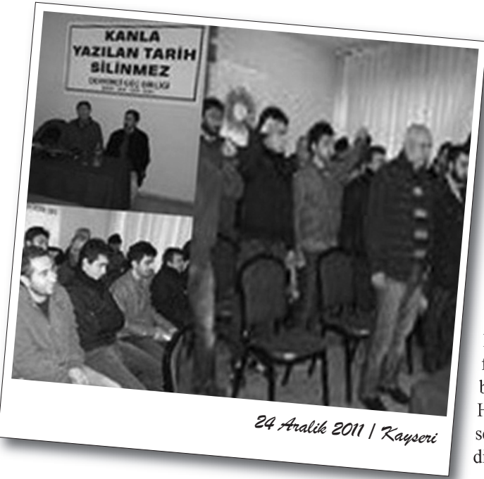
24 Aralık 2011 | Kayseri

Sermaye devleti tarafından Aralık ayında gerçekleştirilen 19 Aralık ve Maraş katliamları Kayseri, Adana ve İstanbul Gazi Mahallesi'nde gerçekleştirilen etkinlik ve eylemlerle lanetlendi.