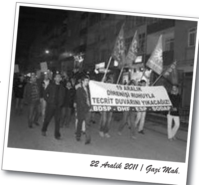
22 Aralık 2011 | Gazi Mah.